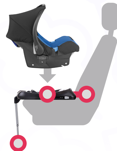
Люлька с опорой